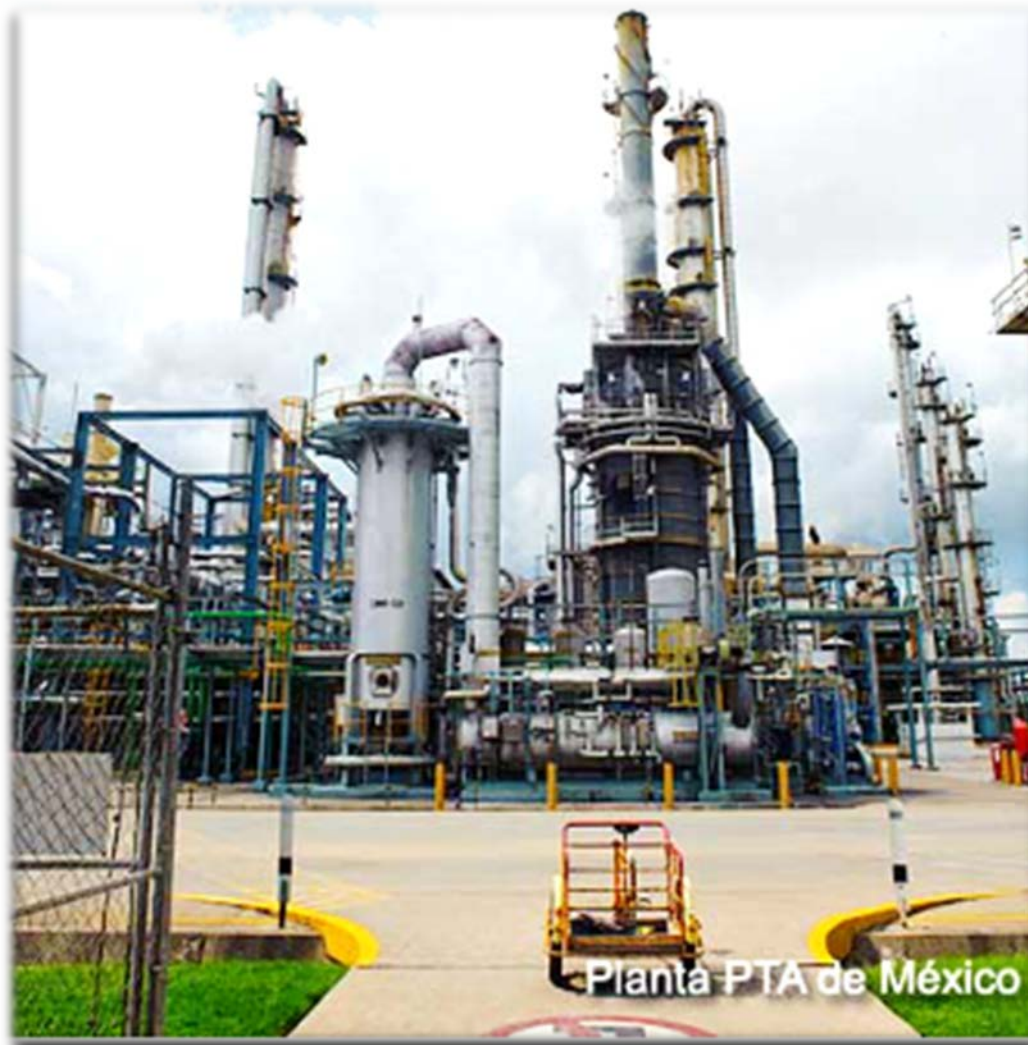
Planta PTA de México